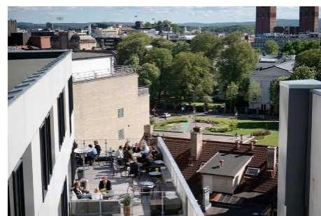
Sentralt beliggende i Oslo Sentrum